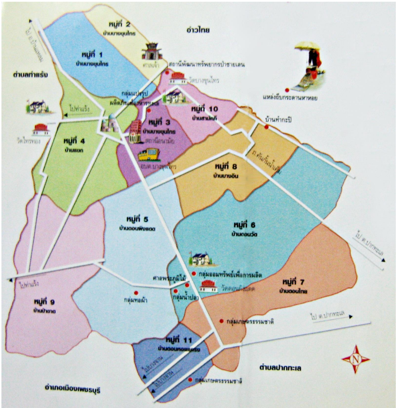
แผนที่ที่ตั้งและอาณาเขตตำบลบางขุนไทร